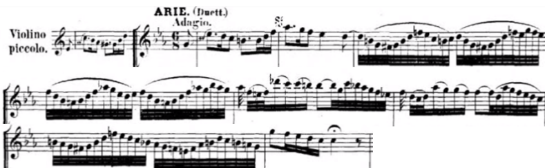
Imagem 3: movimento 3, linha melódica do violino piccolo. 145

“desperta impressões místicas em seu caráter sensível e ansioso: o amor mundano e o amor celestial são fundidos num amor único.” 143 Segundo Pirro, musicólogo e organista francês, neste dueto, há um violino solo que articula suas notas com uma veemência perturbadora que dialoga com as vozes. Este movimento, discreto e um pouco arrastado, sustenta o diálogo apenas por repetições. 144