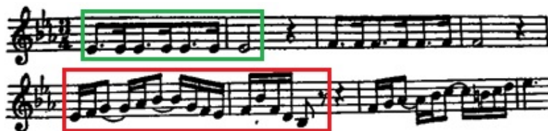
Imagem 1: em vermelho: o motivo; em verde: representação sonora do carrilhão. 138

O primeiro movimento é o coral de abertura. É interessante notar que nesse movimento há um motivo 134 que pode ser traduzido como expressão “de pé”; esse semelhante motivo pode ser encontrado também na ária “Meu Jesus ressuscitou” [Mein Jesus ist erstanden] da BWV 67 [Halt im Gedächtnis Jesum Christ]. Alguns compassos antes, também no coral de abertura da obra Wachet auf, ruft uns die Stimme , é possível ouvir o carrilhão ao longe; o noivo se aproxima em meio as virgens que se levantam assustadas. 135 A característica desses movimentos são os movimentos melódicos das partes orquestrais que combinam com outros instrumentos e voz; o cantus firmus 136 do soprano, que canta a melodia do hino reforçada por uma trompa; os dozes versos deste movimento podem, simbolicamente, corresponder à meia-noite. 137